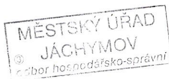
Adéla Strnadová úředník Odboru hospodářsko správního

ve smyslu ustanovení § 73 odst. 1 zákona č. 500/2004 Sb., správní řád, ve znění pozdějších předpisů dne 07. 06. 2017 .